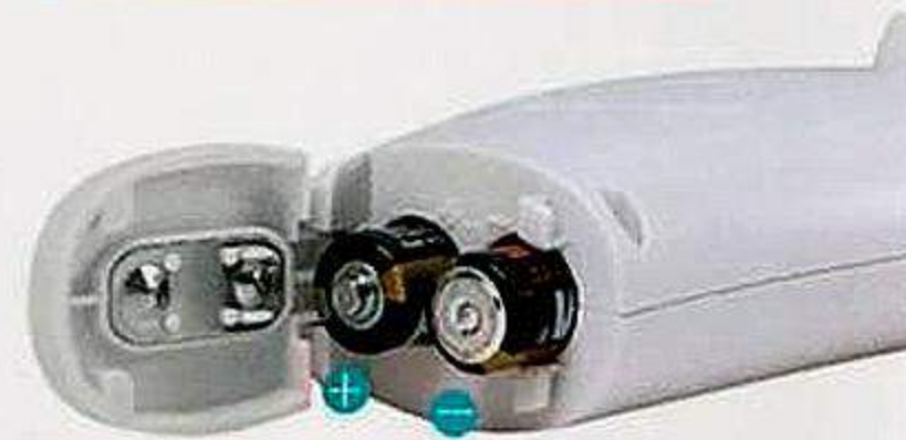
Example Of Correct Battery Installation